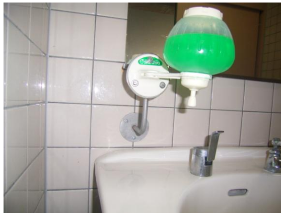
手洗い洗浄器取付金具 (第 2 体育館身障便所)