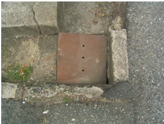
(実施写真) 会所の蓋 (旧教養地区)