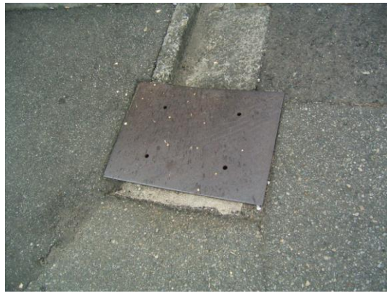
会所の蓋 (旧教養地区)