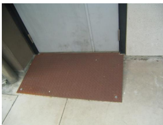
工学部 D 棟 スロープ