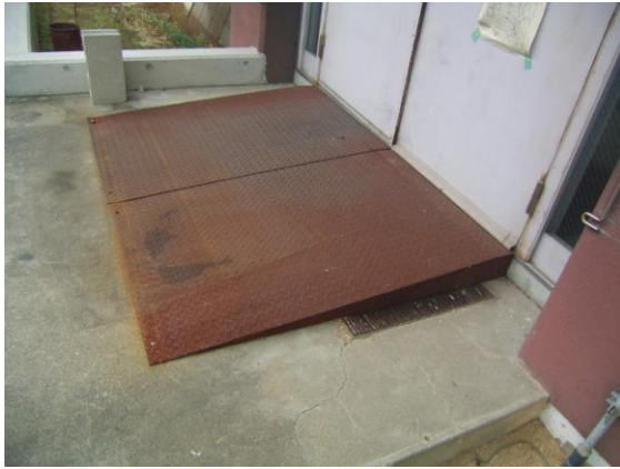
(実施写真) 工学部 B 棟 スロープ