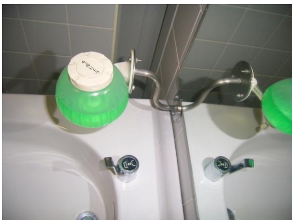
(実施写真) 手洗い洗浄器取付金具 (全学教育棟身障便所) 門受口金具 (田中記念館出入口)